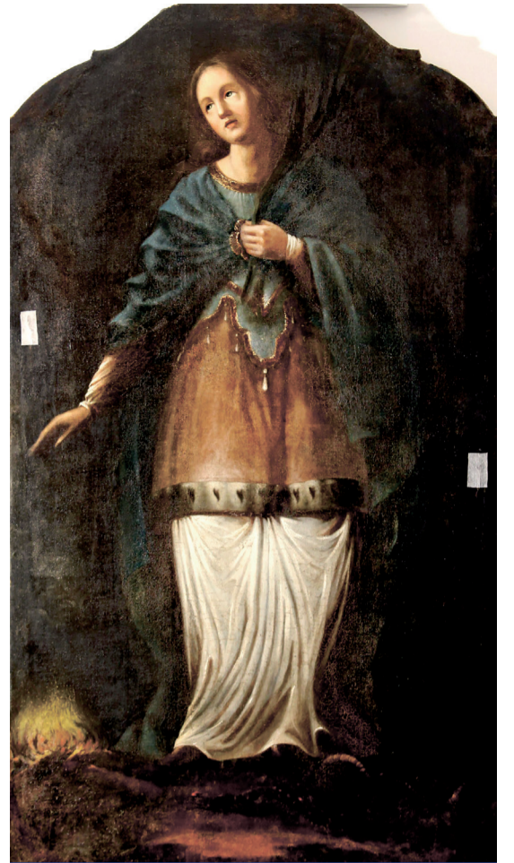
«Свята Текля Іконійська». Кінець XVIII ст. Полотно, олія. Походить із храму Успіння Пресвятої Діви Марії с. Вишеньки Рожищанського благочиння. Зберігається в Музеї волинської ікони